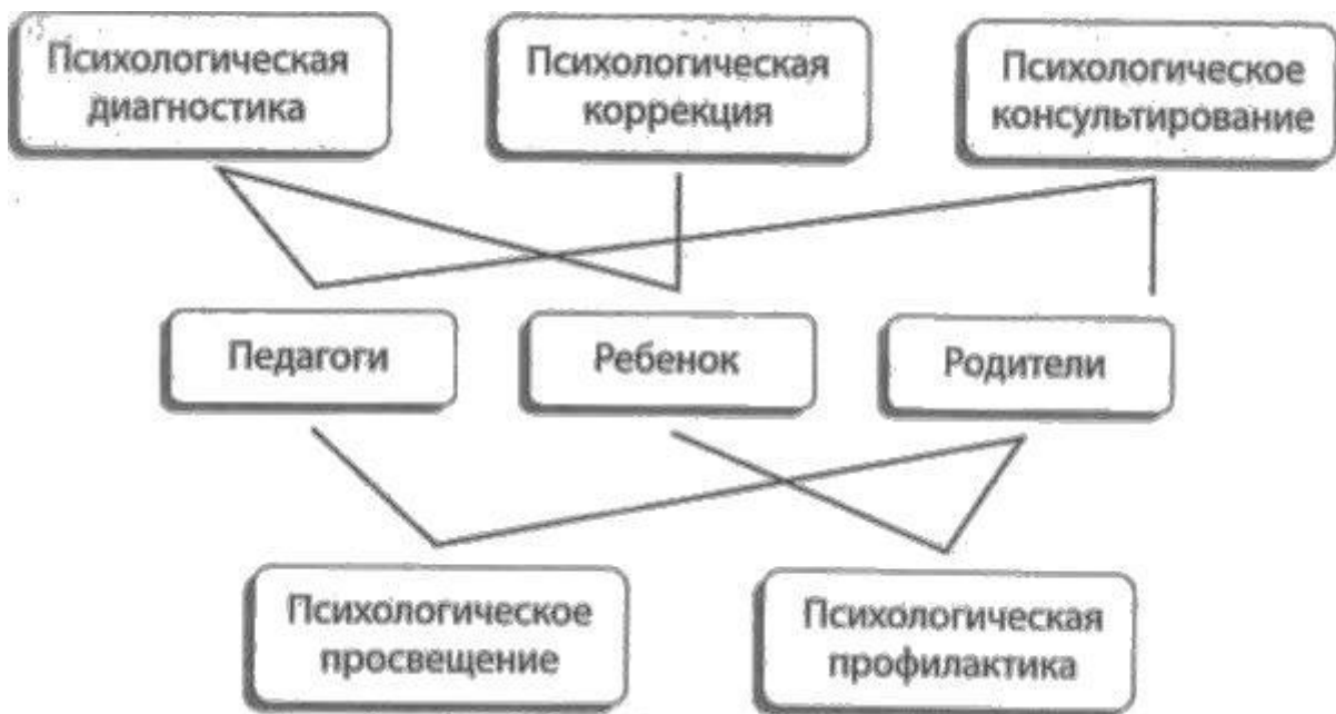
Схема психологического сопровождения участников образовательного процесса

Структура психологического сопровождения участников образовательного процесса представлена на схеме: