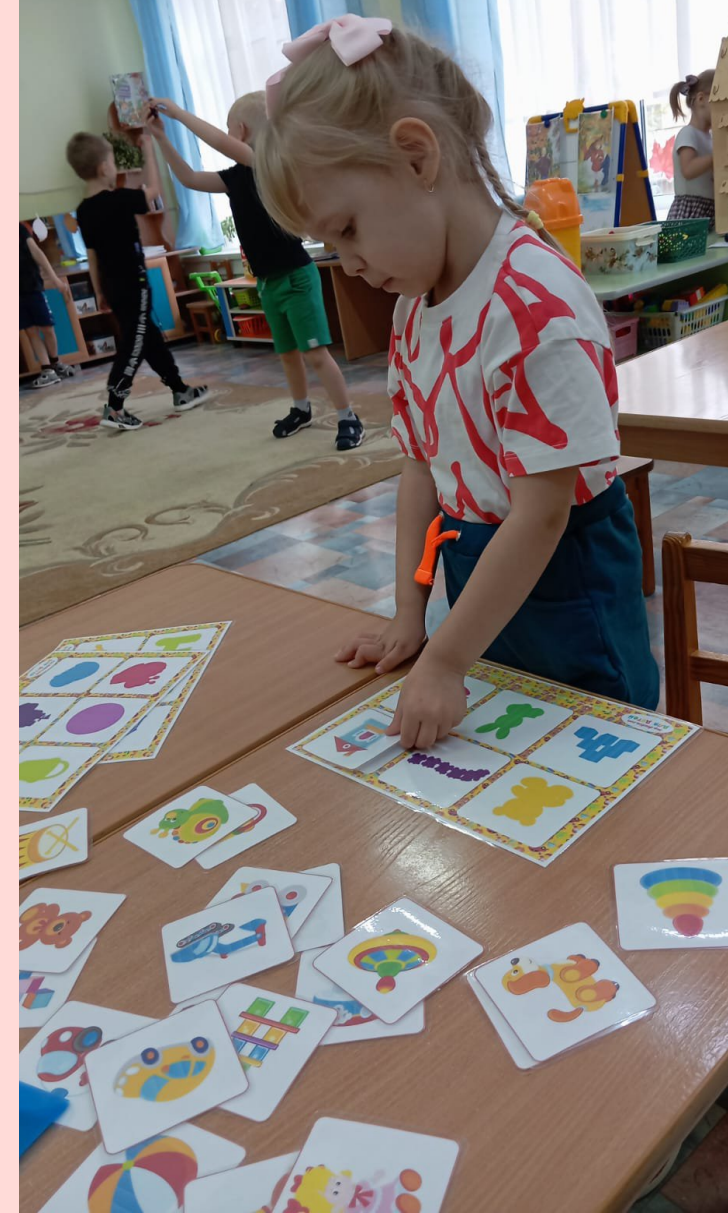
Тема недели: «Игрушки» Д/и: Теневое лото