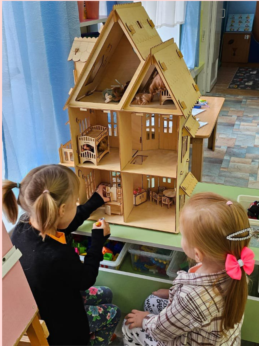
Тема недели: «Дом. Квартира» СРИ: «Дом моей мечты»